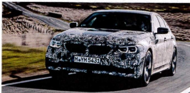
New 5 Series prototype Driven