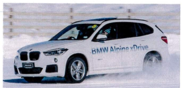
BMW Alpine xDrive