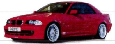
Alpina B3 3.3 รถในฝันของคนรัก Alpina

Vol.2 Issue 22 | October 2016 | www.bmwcarmag.com